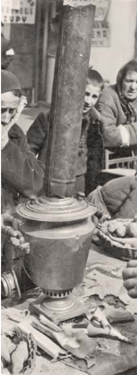
נער מוכה רעב בגטו ורשה