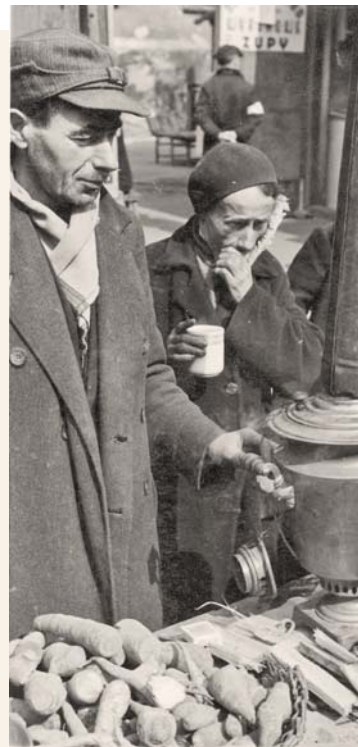
חלוקת מזון בגטו ורשה

העיון בכתב היד מלמד שאכן אין דרשותיו עשויות מקשה אחת אלא שכבות-שכבות, הגהות על גבי הגהות. השלב הראשון של ההגה נמצא למעשה עוד בגוף הטקסט בכתב היד, במחיקת מילים בקו רוחבי החוצה אותן ובתוספות של מילים ומשפטים על גבי המילים הקיימות או על גבי המילים המחוקות. ההגה הנוספת נעשתה בסימני החץ המורים על תוספת בשולי הצד של הגיליון. עוד שלב של ההגהות נעשה בתוספת אותיות לגוף הטקסט, כתובות בכתב מרובע (אשורי) ומתחתן קו הדגשה. האותיות האלה הן סימן הפניה להגהה בשולי גיליון הדף למעלה ולמטה, ולא בצדדים כמו סימני החיצים. אות הפניה בגוף הטקסט רשומה