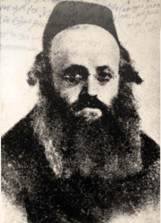
הרב קלונימוס קלמיש שפירא

דרשות זה יצא לאור בפעם הראשונה בשנת תש"ך (1960) בשם אש קודש ולאחר מכן בתשס"ח (2007) בשם דרשות משנות הזעם, והוא למעשה הספר החסידי האחרון שנכתב על אדמת פולין. את הדרשות נשא האדמו"ר מפיאסצנה בשבתות בעל-פה ולאחר השבת העלה אותן על הכתב. הכתיבה בעברית רבנית, אם כי סביר להניח כי הדרשות נאמרו ביידיש. יש לציין כי הדרשות הכתובות עצמן אינן מדברות במישרין על אירועים פוליטיים והיסטוריים. האדמו"ר לא הזכיר בהן, ולו פעם אחת, את הגרמנים בשמם, אישים מרכזיים בגטו ואירועים מסוימים במישרין. 2 עם זאת הדרשות עוסקות עיסוק רב ב"רשעים", בסבל, בייסורים במצוקה הגופנית והנפשית, בצער על איבוד האהובים ובמשבר הדתי והאמוני. העיסוק העיקרי של הספר הוא אפוא תופעת הייסורים ומשמעותה הדתית.