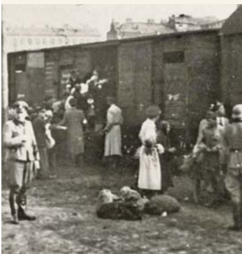
גירוש יהודי ורשה, קיץ תש"ב

ייחודו של ספר דרשות זה הוא שהוא עוסק מראשיתו ועד סופו בתאולוגיה של הייסורים, מתוך חוויה אישית: "כשלמדנו בדברי הנביאים ודברי חכמינו זכרונם לברכה מצרות החורבן, חשבנו שיש לנו איזה השגה בצרות אלו, אף בכינו אז לפעמים. עכשיו רואים שלשמוע צרות, ולראותם ומכל שכן לסבלם רחמנא ליצלן, כמה רב המרחק, עד שכמעט לא מיניה ולא מקצתיה [...] וכמה שאומרים בפינו מן הצרות לא נוכל לתארם כפי שהיו באמת, כי אינו דומה הידיעה והדיבור מהצרות לראיה". 6 יתר על כן, האדמו"ר משתף את הקורא בלבטיו ובספקותיו האינטימיים ויוצר בכך מסמך מרגש וייחודי. לאחר בחינת כל הדרשות אפשר לומר שאין לאדמו"ר אמירה ברורה ונחרצת, לא באשר למהות הייסורים ואף לא באשר למטרת הדרשות. הדרשות משקפות תהליך, ומי שמתלווה אליהן מתלווה, ככל האפשר, לתהליך האישי שעבר האדמו"ר. בראשית הדרשות הוא מצהיר שמטרתו לחזק ולעודד: "שגם אתם נתחזקתם על ידי", 7 "כשראו שאר אנשים שגם בצרותי כל כך גדולות מתחזק, התחזקו גם הם מקל וחומר בצרותיהם שלא היו כל כך מרים כמו אלו שלי". 8 לעומת זאת, לאחר כשנתיים, האדמו"ר מתוודה ואומר כי אינו