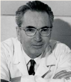
ויקטור פרנקל

עצמם, והעיסוק בהם הוא ניצחון הרוח על החומר ועל המוות. הפילוסופיה היוונית לא ראתה בפילוסופיה תורה אינטלקטואלית גרידא אלא תורה שמבקשת לגאול את האדם. האדם שחי את חייו מתוך זיקה לחוכמה הוא האדם השלם שמממש את הפוטנציאל שלו. כאשר גזר בית המשפט באתונה את דינו של סוקרטס למיתה בשנת 399 לפני הספירה, הייתה לו האפשרות להתחמק ולהמיר את העונש בעונש אחר, ואולם סוקרטס החליט משיקולים פילוסופיים לשאת את עונשו ולשתות את כוס התרעלה. אפלטון קבע כי מוות זה הוא ניצחון של הפילוסוף ושל הפילוסופיה. 12 העיסוק בפילוסופיה גבר על הפחד הטבעי מן המוות. אין כאן התחמקות כי אם התנצחות. גם מלאכת הכתיבה הספרותית יש בה משום ניצחון הרוח על החומר. על פי מודל זה, כתיבתו של האדמו"ר אינה בריחה מן העולם ומן המציאות, ואין הוא מעוניין להנציח את עצמו באמצעות הכתיבה. הוא מבקש לא להִנְצִיחַ כי אם לְנַצֵּחַ.